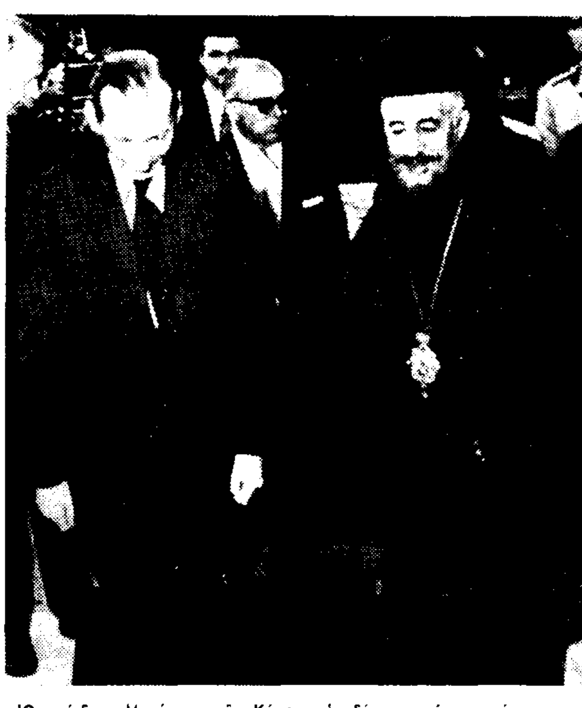
Ο πρόεδρος Μακάριος, της Κύπρου, υποδέχεται τον γενικό γραμματέα του Ο.Η.Ε. δόκτορα Κούρτ Βάλντχαϊμ...