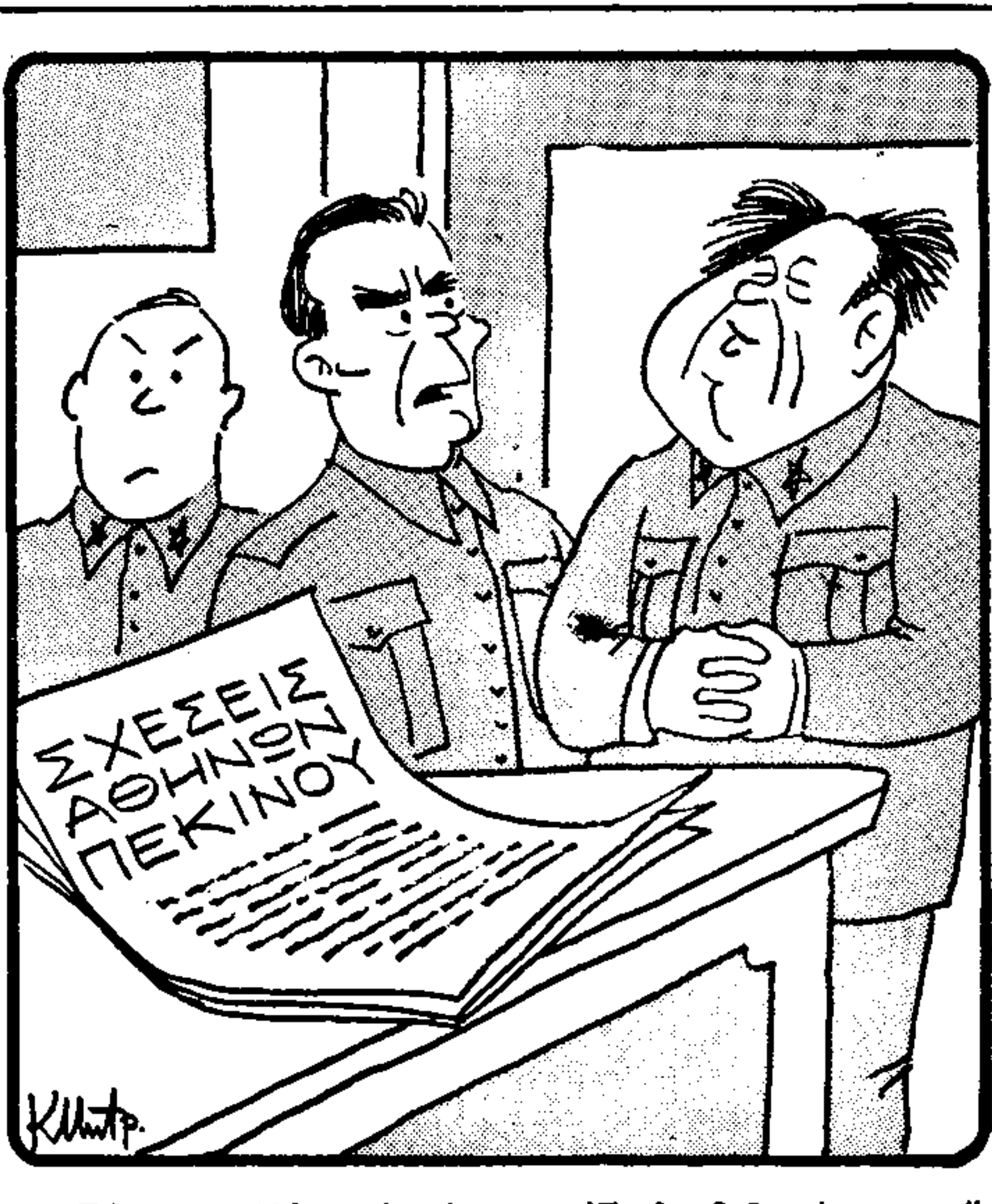
— Σύντομο Μάο, τί γίνεται; 'Εμείς δεξιόφρονες ή αυτοί άριστεροί; (Τού Κώστα Μετράκουλου)